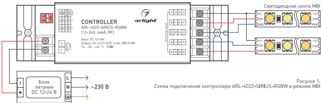
Рисунок 1. Схема подключения контроллера ARL-4022-SIRIUS-RGBW в режиме MIX