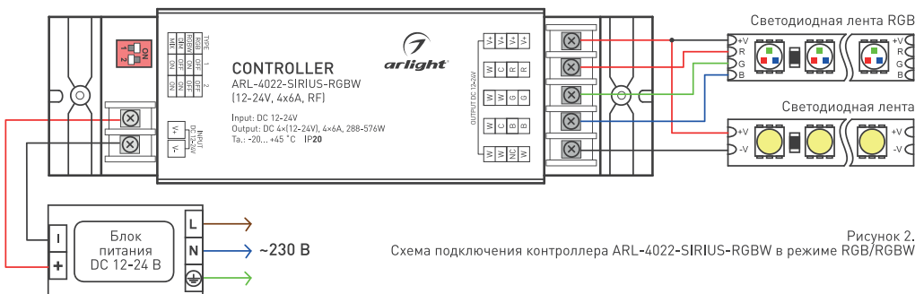
Рисунок 2. Схема подключения контроллера ARL-4022-SIRIUS-RGBW в режиме RGB/RGBW